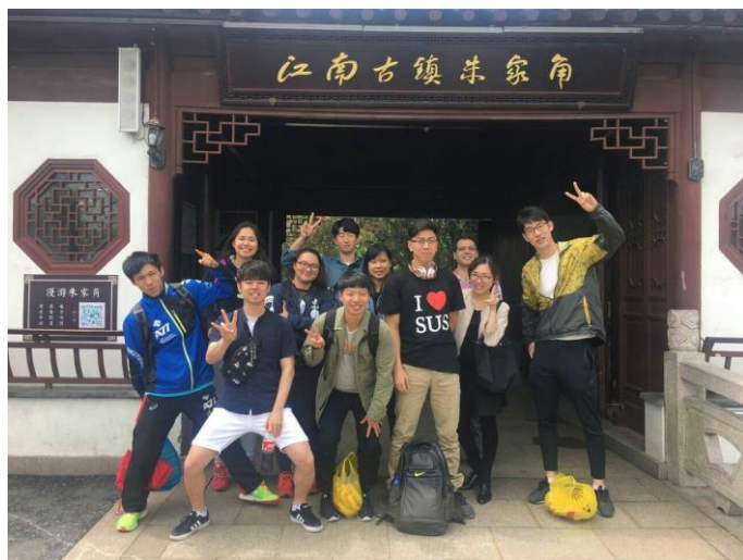
與台辦老師一日遊-朱家角