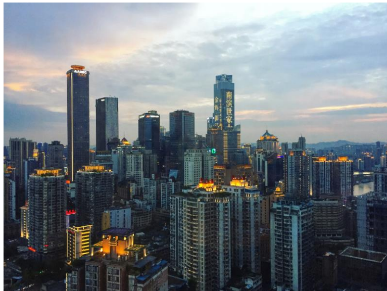
從青年旅社向外拍的重慶