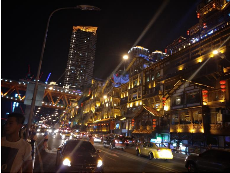
重慶-洪崖洞(據說是神隱少女取景地)