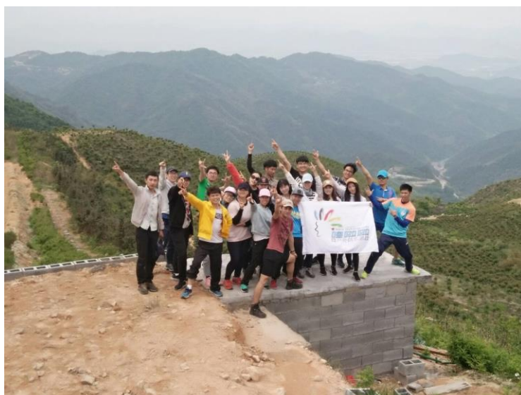
嚕啦啦社員大合照