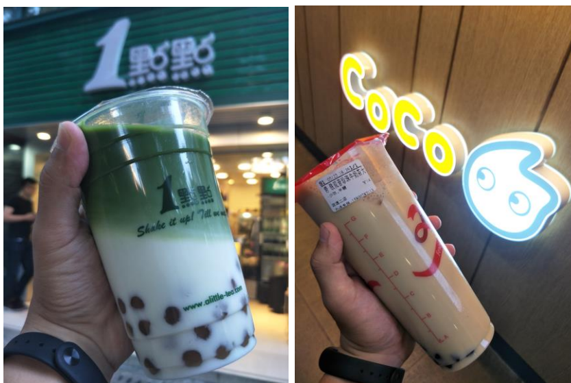
圖為 1 點點及 COCO

飲食方面大致跟台灣相去不遠，而且價格大多很便宜，以學校餐廳的消費來說，一位大男生吃飽只要約台幣 50 元(食量小花費更少)，但大部分的食物都很鹹很油(對我來說)，以我來說適應了 2 禮拜。外食價格方面跟台北物價差不多。如果想喝一杯珍奶，不用擔心，很多都是台灣業者開的，例如：50 嵐(中國店名為：1 點點)、COCO、貢茶等等，不過要付出的代價大多都是台灣珍奶價格的兩倍。而雞排就跟台灣是天差地遠了。也會有許多小吃店打著台灣的名號，品嚐後卻一點也不台灣味，價格也不親民，所以嘗味道就好，別一次點太多呀~~~