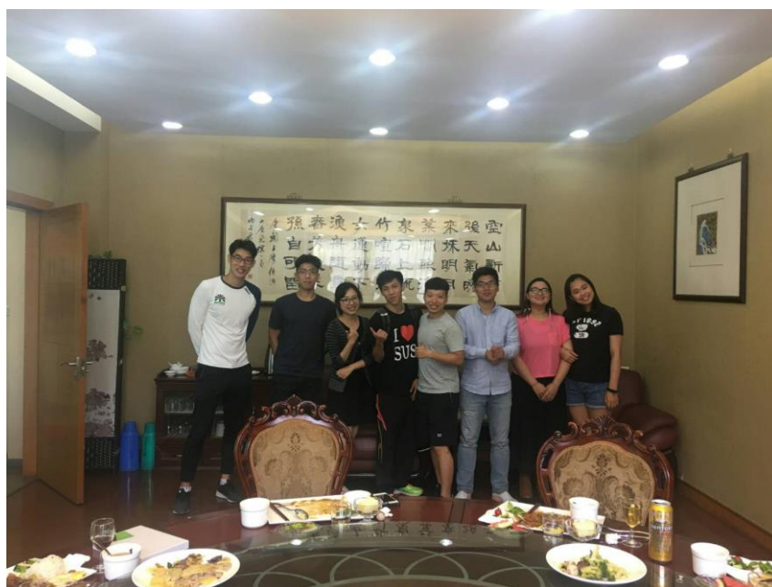
與台辦老師的餞別餐敘