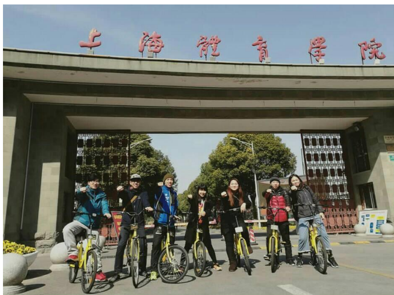
與台灣交換生在上體的正門合照