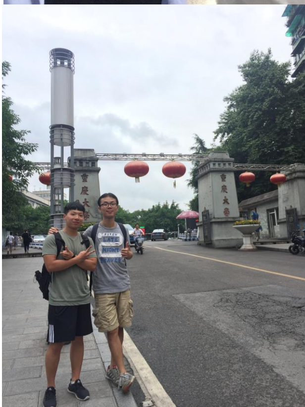
在重慶認識的新朋友