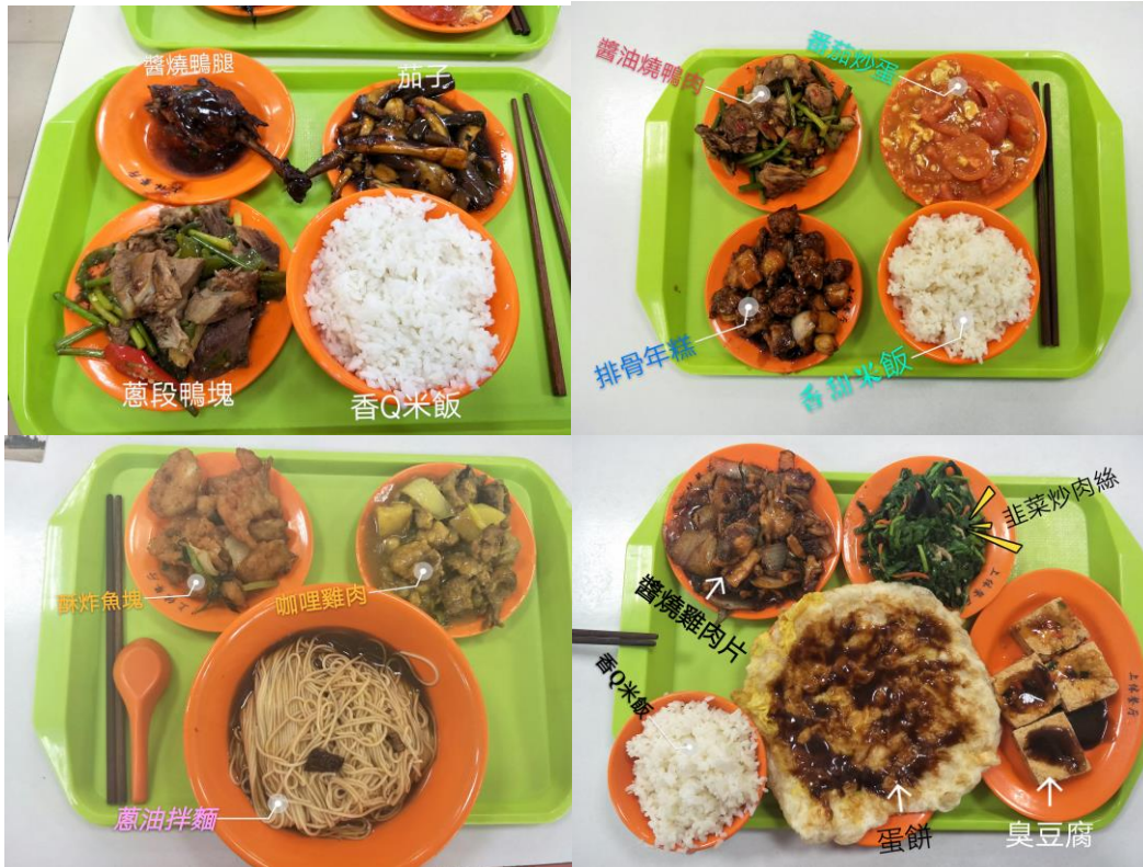
上海體育學院餐廳美食