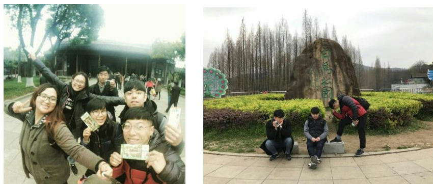
與韓國交換生遊南京

五、就體大的就讀經驗與締約學校的交換心得，您有無任何建議提供給本校作為改善之處？