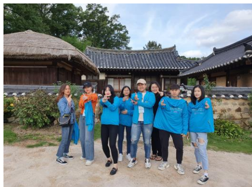
韓中越出去拍的團體照(歷史村落-良洞村)