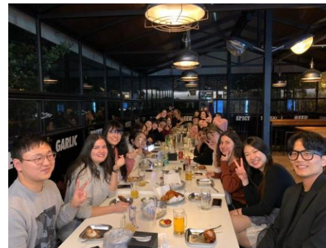
SISO 團員們和 EF 學生們交流會完聚餐