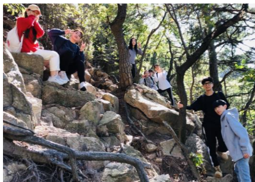
SISO-登山(人生第一次登這麼累的山...)