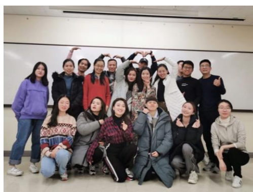
中級班語學堂最後一堂課的大合照