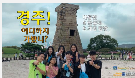
韓中越三天兩夜每天都要生出 YOUTUBE 影片(免費出去玩但真的是很累人啊!!!)