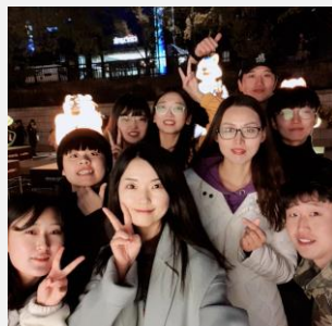
語學堂也有一堂文化體驗課這次帶我們去看 在清溪川的燈節，看完還走去廣藏市場聚餐!