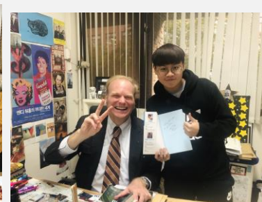
英語會話老師聽到我們從台灣來的,就把自己和台灣教授合作出的書送了一本給我們^0^