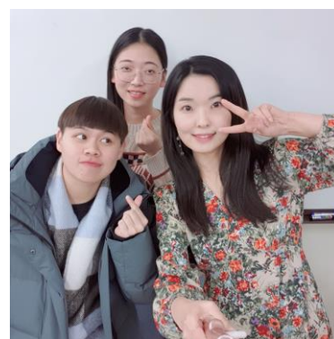
當然，那麼愛那老師的我一定要合照一波拉<3