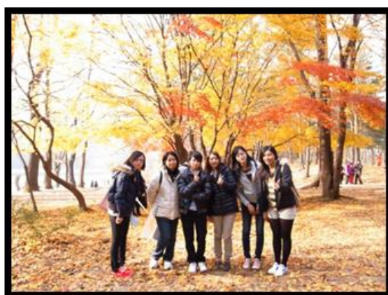
冬季戀歌拍攝場景-南怡島

另外由韓體大的同學及一位之前曾來本校交換的韓國學長，帶我們一路從明洞走到仁寺洞，沿途欣賞首爾的美景，還有韓國最具特色的景福宮。我們也剛好遇到了今年邁入第四屆的「首爾燈節」，令我大開眼界的是，燈籠是展覽在清溪川裡，精緻的花燈放在架在溪上的平台上，比起台灣的巨大主燈，延伸 1.5 公里的花燈更是另一種風情。因為去的時間在晚上，所以我們在景福宮前的那些世宗大王雕像等都無法看清楚，也趕不上了在仁寺洞的藝術節商家的營業時間。如果我們能在行程規劃上加入這些韓國知名的景點和當地節慶，也許文化交流的意義會更深刻一點。