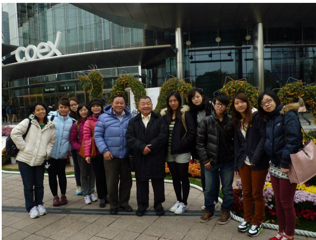
(本次交流團三位老師與九位學生於 COEX MALL 前合影)