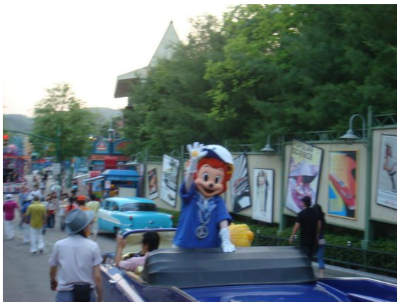
愛寶超人氣吉祥物

說真的來到這裡也沒有什麼出去玩到，因為都在訓練，有時假日也會自主訓練一下，所以有時間也頂多到明洞或東大門走一走，這也是讓我覺得比較可惜的事，因為來到了這裡卻沒有機會好好得出去玩玩，唯一映像深刻的就是到愛寶樂園玩，愛寶樂園算是新的樂園，因為它位於在郊區！所以占地也就很大，一個樂園上上下下的走，還不是劍湖山世界那樣子簡單，是走到你腳會抖的，他們的主題樂園偏向美式，像個童話故事然而小朋友家長、情侶也就跟著多了！這是大家假日約會、增進親子關係的好地方。