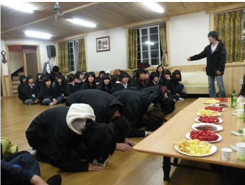
韓國新生跪拜老師